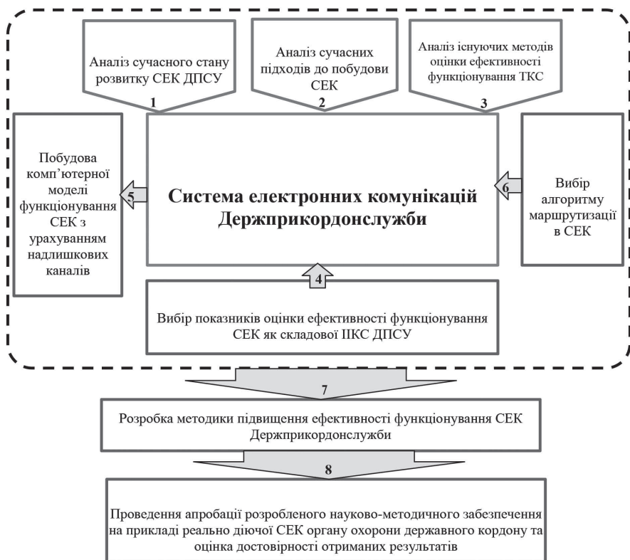
Малюнок 1. Схематичне представлення підходу до створення методики підвищення ефективності функціонування СЕК Держприкордонслужби

Виходячи з аналізу стану СЕК Держприкордонслужби, системи показників ефективності сучасних СЕК та існуючих світових методів підвищення ефективності функціонування цифрових мереж була сформований підхід до створення методики підвищення ефективності функціонування системи електронних комунікацій Держприкордонслужби (мал. 1).