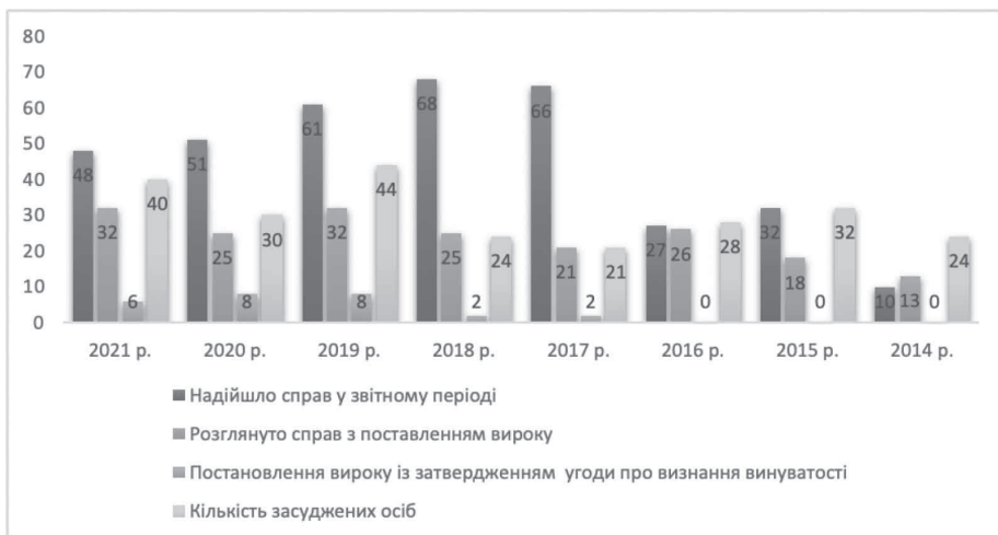
Малюнок 3. Стан розгляду справ та кількість засуджених осіб за ст. 149 КК України

Так, до прикладу, 24 березня 2022 р. було проінформовано про насильницьке вивезення з України 402 тис. громадян України, серед яких 84 тис. – діти 1 . Однак, ці цифри є приблизними, а кількість таких осіб набагато більша, оскільки, якщо говорити про кількість облікованих кримінальних правопорушень, то їх набагато більше, адже торгівля людьми має високу латентність, адже потерпілі від торгівлі людьми не бажають повідомляти про це правоохоронним органам.