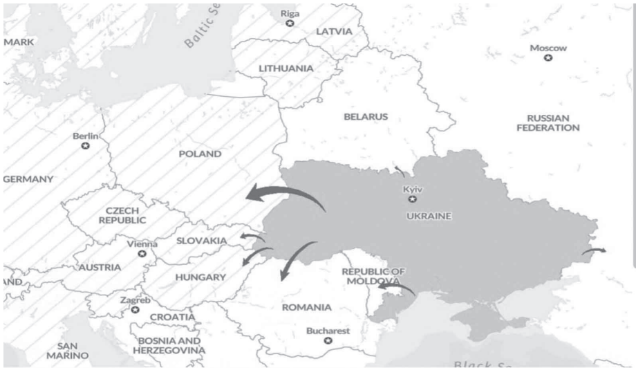
Малюнок 4. Міграція українців через збройний конфлікт

Варто відзначити, що за даними ООН, загалом з початку збройного конфлікту з України виїхало 6 801 987 українців. Основними напрямками виїзду стали – Польща, Угорщина, Словаччина, Румунія, Молдова та інші країни Європи. Певна кількість виїхала і до росії, а також до білорусі (більш детально див. мал. 4) 2 .