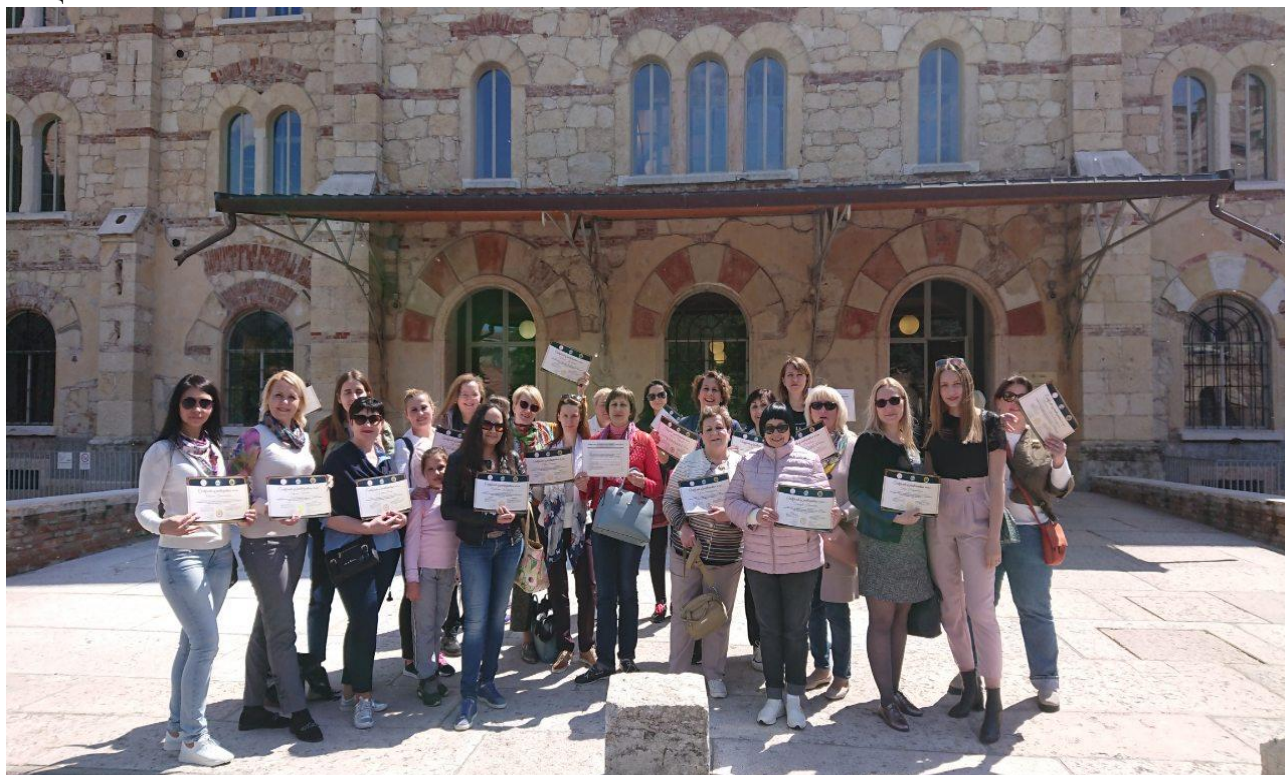
Університет м. Верона. Італія, 2019

4. Представники РМВ ВНЗ «НАУ» регулярно відвідують закордонні ЗВО (Відень (Австрія), Верона та Падуя (Італія)) з метою вивчення кращих зарубіжних практик надання вищої освіти.