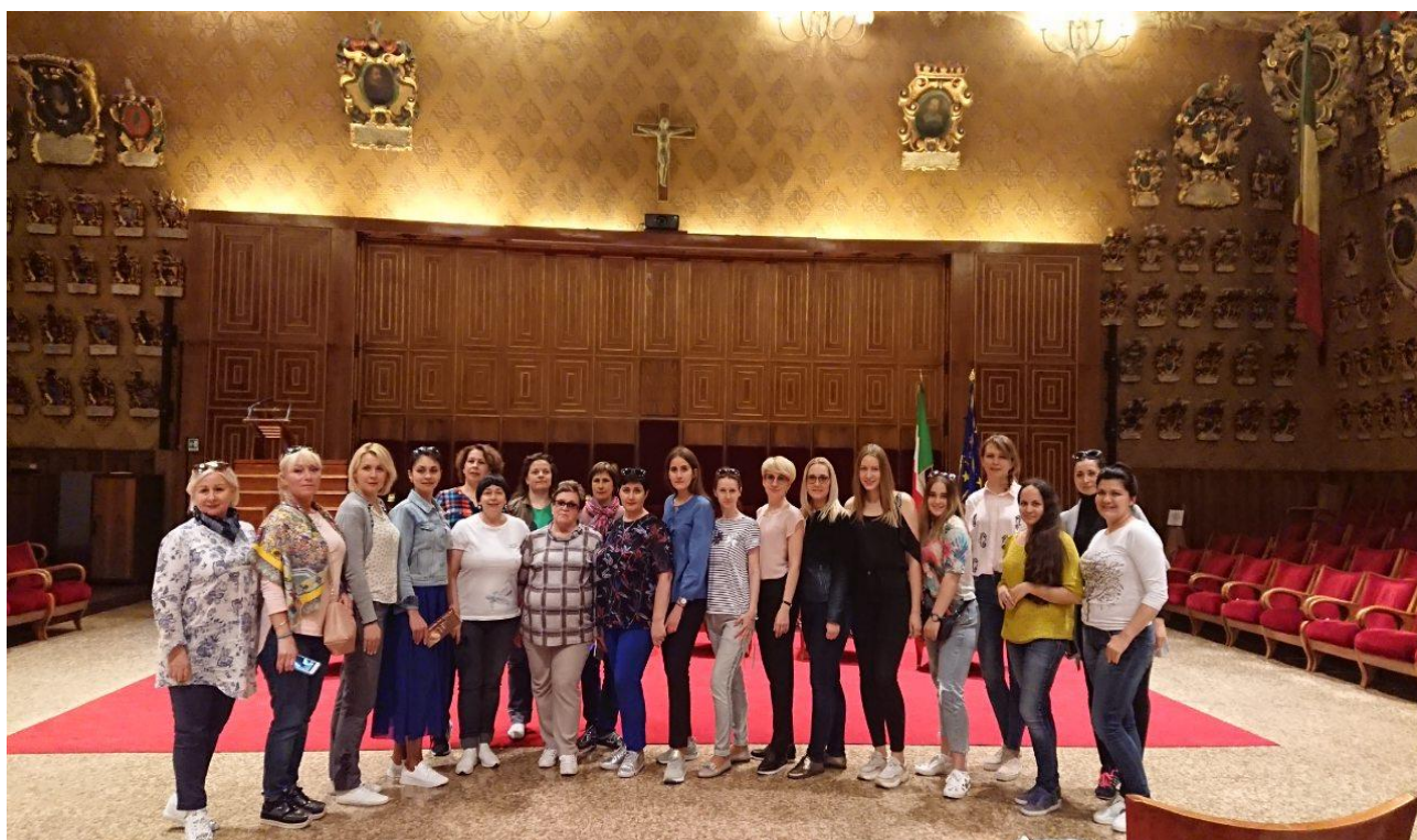
Університет м. Падуя. Італія, 2019